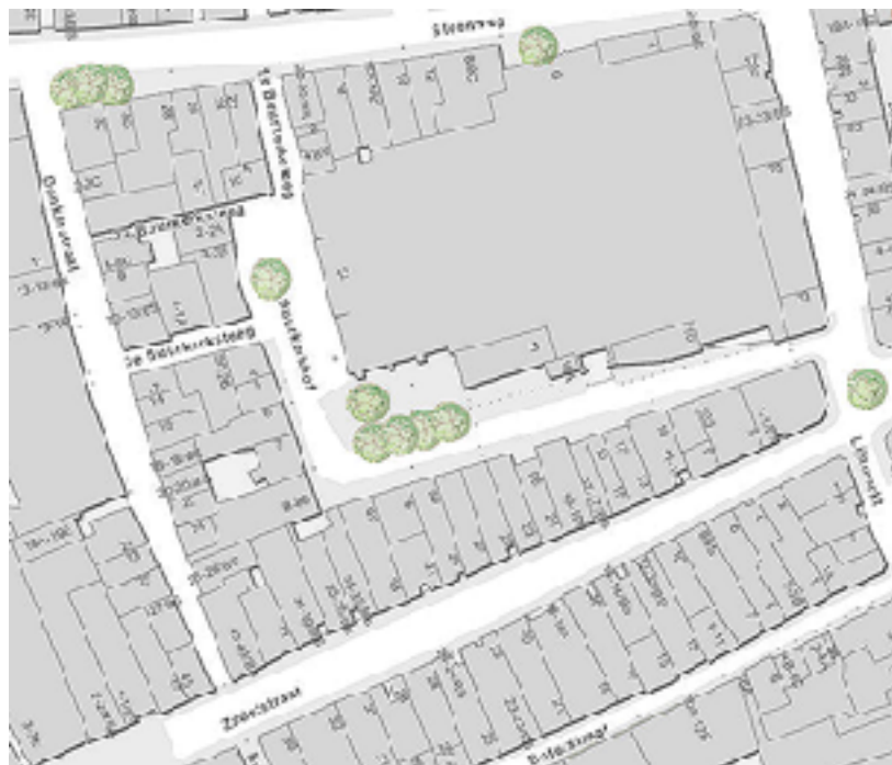
Op dit deelkaartje ziet u links de Donkerstraat - waar Antje woonde op de hoek van de 3e Buurkerksteeg - en de straten en steegjes rondom.